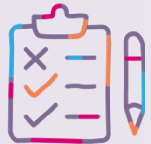
TABLA DE REVISIONES